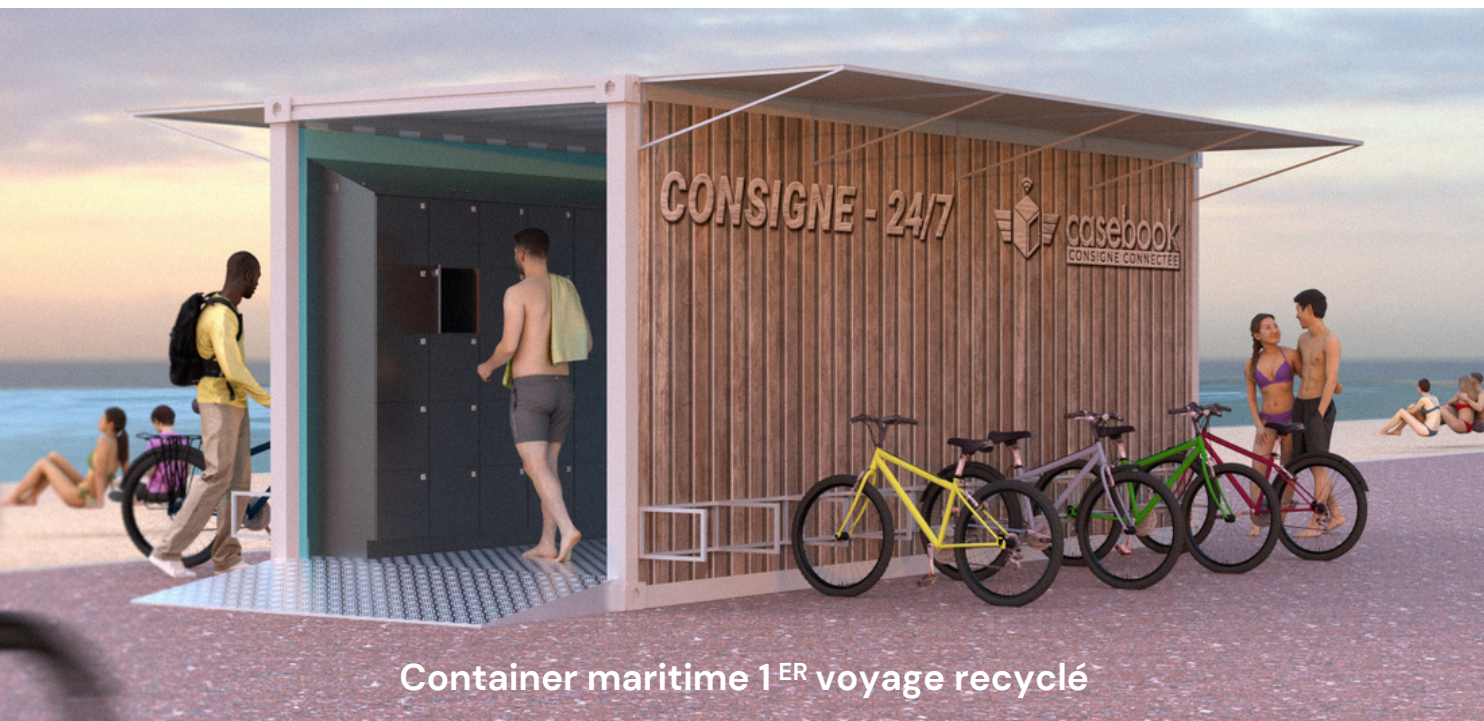
Container maritime 1 ER voyage recyclé